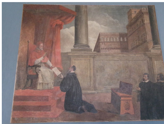
4. kép IV. Piusz a Velencei Köztársaságnak adományozza a San Marco palotát. 17. századi ismeretlen festő alkotása