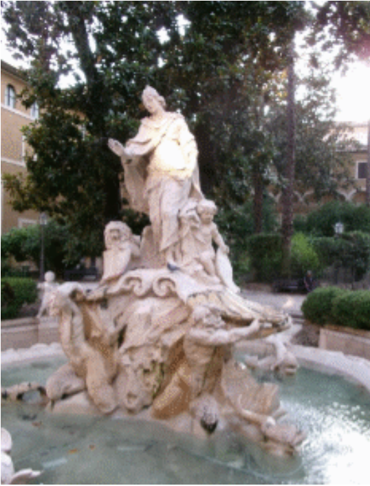
6. kép A Monaldi-kút a viridarium közepén