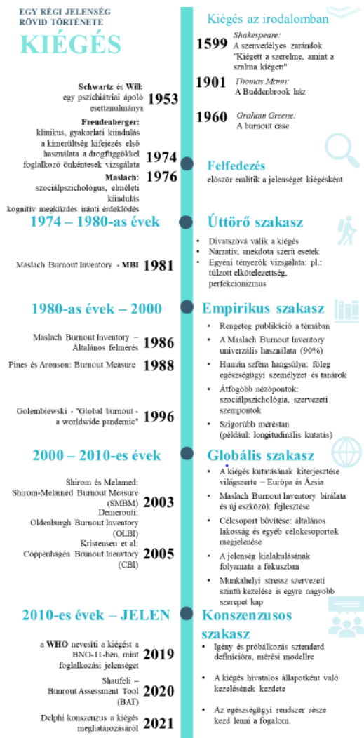
1.ábra. kiégés kutatásának fázisai Szigeti 24 alapján

szág – köztük Magyarország bevonásával – harmonizálták a meglévő definíciókat, és a munkahelyi kiégés egyetértésen alapuló fogalmát dolgozták ki (Szigeti, 2023). Az 50 főből álló szakértői testület 80%-os egyetértéssel fogadta el a következő definíciót 23 : „A munkavállaló esetében a munkahelyi kiégés (‘professional burnout’) vagy munkából adódó fizikai és érzelmi kimerültségi állapot, a munkával kapcsolatos problémáknak való tartós kitettség miatti kimerültség.”