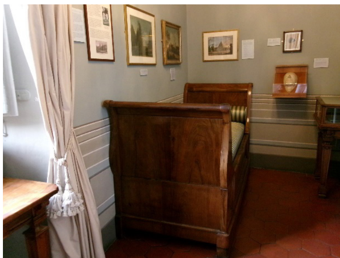
6. kép J. Keats hálósobája a Piazza di Spagna-n

A Piazza di Spagna 26. szám alatt található ház John Keats-nek és Percy Bysshe Shelley-nek állít emléket, akik Goethehez hasonlóan ugyancsak az Örök Városban találtak szellemi inspirációra. A múzeum, melyet az angol Keats-Shelley Memorial Association működtet, 1909-ben gazdag tárgyi anyaggal nyílik meg. A memóriaintézmény, melyhez egy több mint nyolcezer kötetes értékes könyvtár is tartozik, sokrétű kulturális tevékenységet folytat: bemutatótereiben tanórákat, múzeumpedagógiai foglalkozásokat és számos tematikus programot is tartanak.