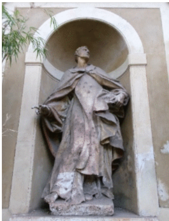
5. kép Az 1731-ben XIII. Ince által szentté avatott Orseolo Péter szobra a palazzo díszudvarán