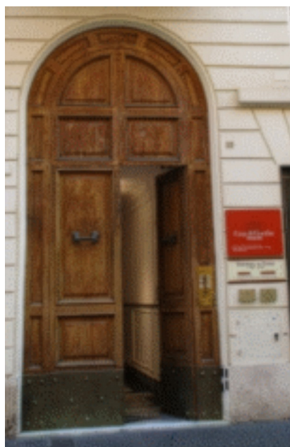
1. kép A Casa di Goethe bejárata

A Porta Flaminianán, Róma északi városkapuján áthaladva a Santa Maria del Popolo templom mellett vezet az út az Piazza del Popolara, melynek közepén II. Ramszesz fáraó obeliszkje emelkedik. A teret a közel másfél kilométer hosszú Via del Corso köti össze a Piazza Veneziával. A történelmi városközpont e műemlékekkel, barokk palotákkal és templomokkal körülölelt utcáján található az a többszintes épület, melynek falán sötétvörös színű tábla jelzi Johann Wolfgang von Goethe egykori otthonát. A tömör faajtón belépve kanyargós márványlépcsőn jut fel a látogató az emelti szobákhoz, ahol betekinthez a weimari költőfejedelem „életének egyik legboldogabb időszakába”. (Eckermann, 1889)