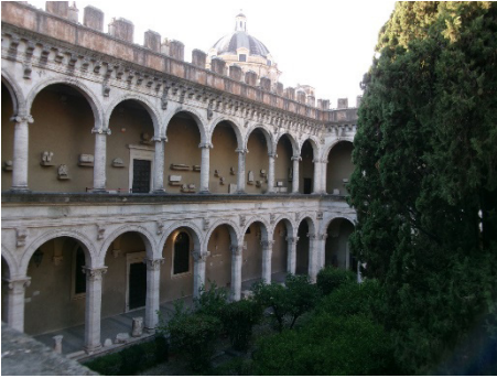
9. kép A kőtárnak otthont adó kétszintes árkados oszlopcsarnok 6

Az 1980-as és 1990-es évek a blockbuster kiállítások korszaka. Megrendezik a Museo Centrale del Risorgimentoval közösen a nagyszabású Garibaldi-tárlatot, a nemzetközi visszhangot kiváltó Caravaggio kiállítást, valamint bemutatják Pietro da Cortona festészeti és építészeti munkásságát. Az ismét újjáéledő iparművészeti koncepció keretében számos majolika, bronz és terrakotta artefaktum kerül az intézménybe. Maria Giulia Barberini vezetésével 2006-ban megnyílik a lapidárium.