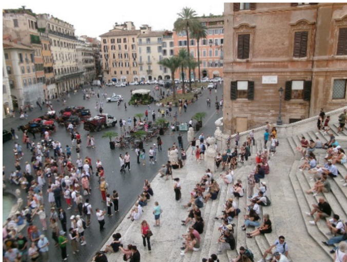
8. kép Kilátás a Keats-Shelley House teraszáról a Spanyol Lépcsőre

Az is kiderül továbbá, hogy Keats és Shelley gyakran meghívtak magukhoz brit művészeket, tudósokat, és rokonaik is olykor felkeresték őket. Shelley-t például többször felesége, Mary, aki a Frankenstein, or The Modern Prometheus (M. Shelley, 1818) szerzője.