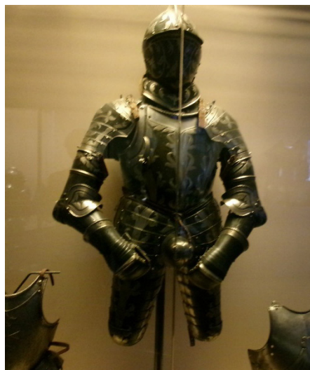
8. kép Gyalogsági parancsnoki páncél a 16. század közepéről

A gyűjteménygyarapítás 1945 után elsősorban Antonino Santangelo igazgatónak köszönhető, aki megvásárolja Evan Gorga, a világhírű tenor kollekciójának jelentős részét (Barberini, Casanova & Zuraw, 1996). Az 1950-es évektől a kurátori szemlélet az ipar- és a díszítőművészet irányába nyit. Az új gyűjteményezési irányvonal jegyében jelentős számú műtárgy kerül a Museo Artistico Industriale -ből a palotába. Így Mino da Fiesole négy domborműve, amely Szent Jeromos történetét mutatja be. A múzeum több mint kétezer hadászati eszközzel tesz szert, amikor 1959-ben megvásárolja Ladislao Odescalchi 5 (1846–1923) herceg fegyvergyűjteményét, amely tematikájában Európa egyik legjelentősebb kollekciójának számít.