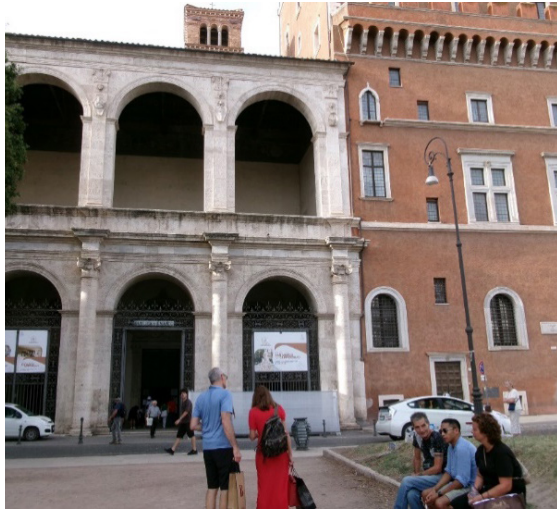
1. kép A San Marco bazilika és a Palazzo di Venezia homlokzata

Az egykori Palazzo di San Marco a Capitolinus északi lejtőjén, az UNESCO által világörökségi helyszínné nyilvánított történelmi városközpontban helyezkedik el (UNESCO, 1980). A Róma szívében a 15. század közepén épült, gazdag történelmi múltra visszatekintő palota többször is jelentős építészeti átalakításokon ment keresztül, amelyek mélyreható változásokat idéztek elő az épület szerkezetében és használatában egyaránt. Középkori jelleget visszatükröző zömök sarokbástyájának és masszív falainak komorságát háromsoros, fehér márvány kőkeresztes ablakok törik meg.