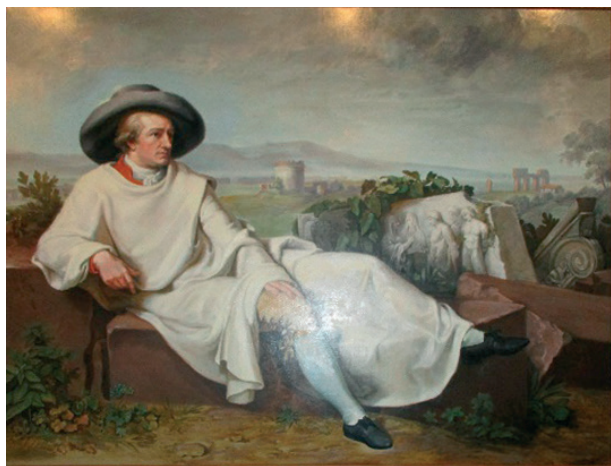
4. kép G. Takev: Goethe in der römischen Campagna című festménye

A lakásban eredeti bútor, berendezési tárgy ebből az időszakból nem maradt fenn, de a spaletták, a színesre festett kazettás mennyezet, a terrakotta padló jelenleg is ugyanaz, mint a 18. század végén. Tischbein számos rajzon megörökítette lakótársa egyszerű szobáját. E falak között rajzolta például a Goethe am Fenster című képét, mely a költőt úgy jeleníti meg, amint a „ Klein Stüppen ” (Gnoli, 1872) ablakából Pincio dombjára tekint. A látogató maga is kedvet érez arra, hogy az ablakpárkányra könyökölve – ahogy ezt