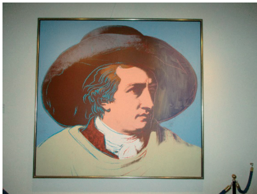
3. kép Andy Warhol Goethe-portréja

Ugyancsak Tischbein előbb említett festménye szolgált alapul Georgi Takev bolgár származású osztrák festőművész Goethe-ábrázolásához (1996), melyen a költő széleskarimájú kalapban és bő fehér kabátban látható egy idilli táj előtt. A képet abban a teremben helyezték el, ahol az eredetit több mint kétszáz évvel ezelőtt Tischbein megfestette (Maurer, 2021). A Frankfurt am Mainban, a Städel Museumban őrzött eredeti olajfestmény a német-olasz kulturális kapcsolatok egyik meghatározó szimbólumává vált (Langenfeld, 2008).