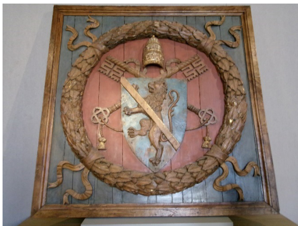
3. kép II. Pál faragott címere az Appartamento Barbo kazettás mennyezetén