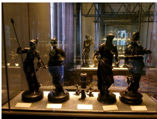
7. kép A Barsanti-kollekció néhány darabja

A Dino Grandi által végrehajtott palotapuccs 1943-ban megfosztja Mussolinit a hatalmától és egyúttal a II. világháborúból való kilépés felé tereli Olaszországot. A szövetséges hatalmak az Örök Várost is elérik. A műemlékekben gazdag Rómát 1943. augusztus 14-én az olasz hatóságok egyoldalúan nyílt várossá ( città aperta ) nyilvánítják, így sikerül a műkincseket és az épített örökséget a további katonai támadásoktól megóvni (Juhász, 2005). A palotában az 1564 óta folyó aktív diplomáciai, illetve politikai élet megszűnik, és egy új örökségvédelmi irányvonal lesz a meghatározó. Néhány héttel azután, hogy a szövetségesek bevonulnak Rómába, a palazzo múzeumként újra megnyitja kapuit a nagyközönség előtt. Aldo De Rinaldis és Emilio Lavagnino 1944 és 1945 között az európai festészet remekműveiből hoz létre kiállítást. Fő feladatuknak tekintik, hogy Olaszország újra felismerje művészeti örökségét.