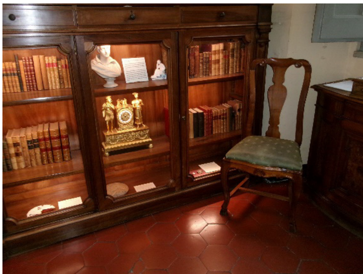
7. kép P. B. Shelley dolgozószobája

A múzeum körbejárása egy közel húsz perces kisfilmmel kezdődik, amely a két költő életét és az angol romantika nagy korszakát foglalja össze. A tárlat részét képezi a The British in Rome című egység, mely az írásos és a képi anyag elrendezésével hívja fel a figyelmet arra, hogy a 17–18. században sok brit fiatal nemes a széleskörű műveltség megszerzése, illetve látókörének bővítése okán végigjárta a Grand Tour -t (Black, 2003). Főként Franciaországba és Itáliába utaztak, sokuknak pedig Róma volt a végső céljuk. Az itt megfordult művészeknek, tudósoknak ekkor a törzshelye a Piazza di Spagna és környéke volt, amit a rómaiak el is neveztek „ Ghetto degli Inglesi ”-nek (Brown – Cacciatore – Haslam – Donini – Payling, 2005).