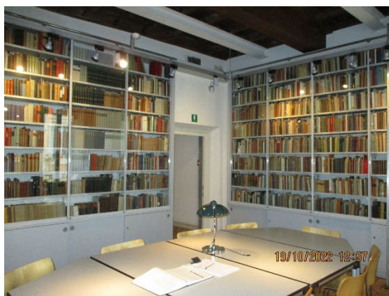
2. kép A római Goethe-ház könyvtári részlege