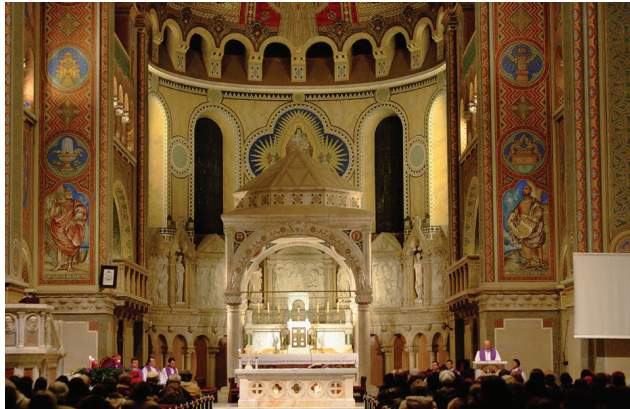
3. A templom szentélye

Milyen módon jelenik meg az eseményekre való célzás az ábrázoláson? A pályázati kiírás között több szempont is szerepelt, mely Éber Sándor festő Glattfelder Gyula püspökhöz írt leveléből ki is derül: