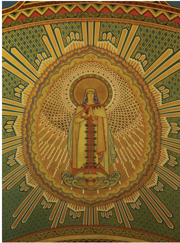
2. Szögedi Mária